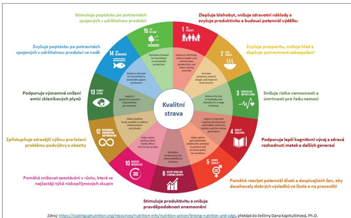
Obrázek 1. Příklad vztahu kvalitní stravy k celé řadě jednotlivých Cílů udržitelného rozvoje OSN (tzv. SDGs) – významné je propojení s environmentálními i socio-ekonomickými aspekty rozvoje.

Celosvětově byly jako rámec udržitelného rozvoje mezinárodním společenstvím přijaty Cíle udržitelného rozvoje OSN, tzv. Sustainable Development Goals (SDGs) 1 , které určují rozvojové cíle pro období v letech 2015 – 2030. Kvalitní strava obyvatel se velmi významně vztahuje k celé řadě SDGs ( Obrázek 1 ). Kvalitou je zde míněna jak výživová stránka stravování, tak socio-ekonomický a environmentální rozměr související s výrobou a spotřebou potravin. Organizace OSN pro výživu a zemědělství definovala „udržitelnou stravu“ následovně: „...strava s nízkým dopadem na životní prostředí, která přispívá k potravinové a výživové bezpečnosti a zdravému životu současných i budoucích generací. Udržitelná strava chrání a respektuje biodiverzitu a ekosystémy, je kulturně přijatelná, dostupná, ekonomicky spravedlivá a přístupná, výživově adekvátní, bezpečná a zdravá a vhodně využívá přírodních i lidských zdrojů.“